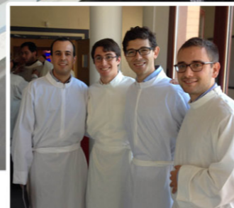
Día del Seminario 2017